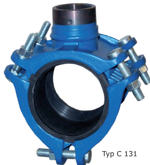
Typ C 131

Die Dichtung sollte vor der Montage mit einem säurefreien Gleitmittel eingestrichen werden.